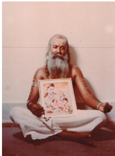
Yogi Ramaiah (1971)