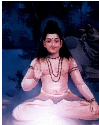
Siddha Nandi Devar

ebenso verurteilte. Als er erkannte, dass Shiva seinetwegen verärgert war, nahm