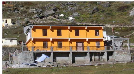
Der im Bau befindliche Ashram in Badrinath

http://www.babajiskriyayoga.net/german/ashram-badrinath.php