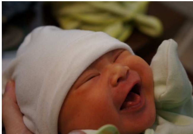
Kippy eine Woche alt

Die Kombination von Parabda Karma (karmische Konsequenzen der Vergangenheit, die in diesem Leben abzarbeiten sind), Vidhya (Das was Licht spendet – das Wissen und die göttlichen Qualitäten, die der Seele helfen, den Weg spirituellen Fortschritts zu gehen) und die Gunas (Attribute der Natur: Tamas – Trägheit, Rajas – Aktivität und Sattva - Ausgeglichenheit) findet statt, sobald die Seele im Mutterleib ist. Die fünf subtilen Körper (physischer, energetischer, mentaler, Weisheits- und spiritueller Körper) werden entsprechend dem Karma der Seele während des Aufenthalts im Mutterleib festgelegt und ausbalanciert. Der alles durchdringende Herr ist ebenfalls als das letztendliche Schicksal der Seele im kleinsten Samen des Lebens gegenwärtig. Tirumular sagt, dass der Herr selbst beim kleinsten Samen weiß, was die Seele nach der Geburt erwartet. Er weiß um all die Erfahrungen, die sie durchleben muss, um ihre karmische Schuld zu reduzieren. Der Körper, der im Mutterleib gestaltet wird, ist dafür das geeignete Instrument.