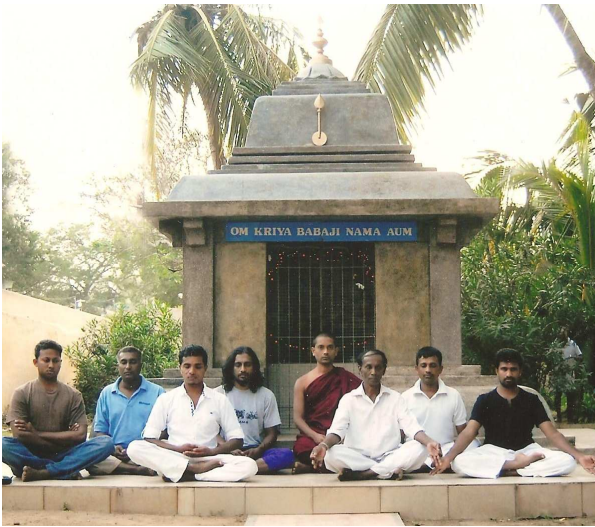
Meditierende am Schrein in Katirgama

dort Schatten zu spenden. Für den Bau eine Gemeinschaftshalle neben dem Ashram werden Spenden erbeten.